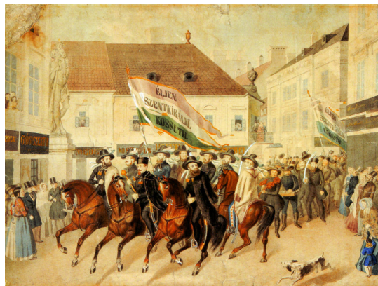
Revolúcia v Uhorsku

Je dobré si uvedomiť a na príklade Nemecka to jasne vidíme, že nacionalizmus bol liberálnou ideou a do politickej arény ho priniesli liberáli, ktorí sa dnes tvária, akoby to bol vynález konzervatívcov. Zjednotenie Nemecka, bez ohľadu na náboženstvo, dejiny, kráľov a kniežatá, bolo liberálnou agendou a keď sa ju nepodarilo realizovať v roku 1848, tak túto ideu prevzal, aby ju realizoval, Bismarck – liberál a bojovník proti katolíckej Cirkvi v službách pruského kráľa.