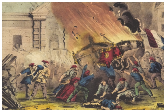
Revolučné nadšenie v Paríži