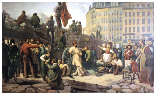
Barikády v Paríži roku 1848

Od roku 1989 má dnešná stredná generácia možnosť sledovať rôzne hromadné a sériové revolúcie vo svete i doma a niekedy v nich aj účinkovať ako komparz. Sériovosť revolúcií, tento výsostne moderný jav, býva zdôvodňovaná prepojenosťou svetovej spoločnosti komunikačnými kanálmi a ľahkým šírením informácií v takomto priestore.