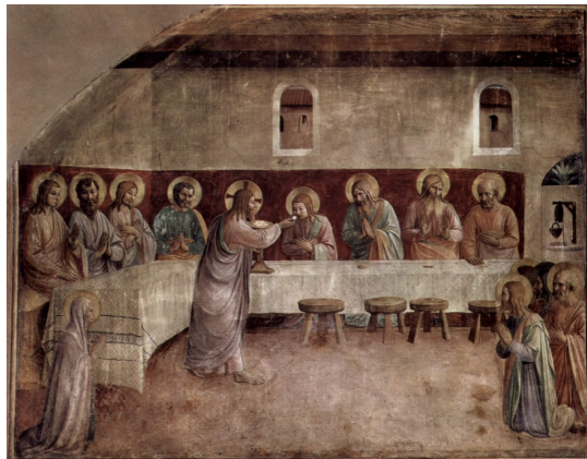
Pán Ježiš pri Poslednej večeri, obraz Fra Angelica

Tento spôsob podávania Eucharistie do úst zachytáva aj krásny obraz z roku 1440 od blahoslaveného Jána z Fiesole, lepšie známeho ako Fra Angelico, ktorý bol florentským rehoľníkom – dominikán a maliar. Preslávil sa nezvyčajným nadaním, ale aj svätým spôsobom života; bol pokorný, prostý a skromný. Evidentne ho namaľoval na základe iného vyobrazenia alebo podľa nejakého textového záznamu či spisu. S istotou sa to však už nedozvieme.