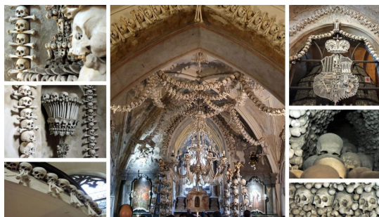
Interiér kostnice v prízemí Kostola Všetkých svätých.

Na začiatku 18. storočia kostolíku a kostnici dali novú tvár opát Snopko a architekt Jan Blažej Santini-Aichel, ktorý interiér kaplnky upravil do podoby tzv. barokovej gotiky. Kosti viac ako 40-tisíc nebožtíkov použil na neobvyklú výzdobu podzemia kostolíka stavebný majster František Rint z Českej Skalice. Stalo sa tak po tom, čo cisár Jozef II. v roku 1784 rušil kláštory, čím zanikol aj ten sedlecký. To sa však už písal rok 1870 a kláštor aj kostolík boli vo vlastníctve rodu Schwarzenbergovcov z Orlíka. Práve erb rodu Schwarzenberg je tu vyskladaný nielen z ľudských, ale aj zo zvieracích kostí. Ostatné interiérové kostrové výzdoby boli už len z pôvodných ľudských ostatkov, ktoré majster Rint najprv dezinfikoval a vybielil chlórovým vápnom.