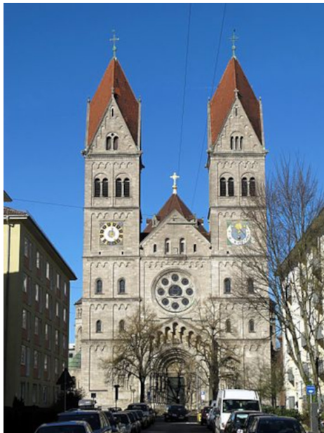
Kostol sv. Benna v Mníchove

Raz ohlasoval pohanom sv. Evanjelium. Títo boli smädní a v kraji tom nebolo prameňa. Sv. Benno vrazil svoju palicu do zeme, a hneď na tom mieste začala vyvierat čerstvá voda zo zeme a občerstvila ich. Ten prameň sa podnes volá «svätá studnička». K večeru jedného dňa prišiel sv. Benno k rieke Labe. Už sa zotmelo, nemohol preto nájsť most. Prežehnal sa znamením sv. kríža a prešiel suchými nohami cez riek.