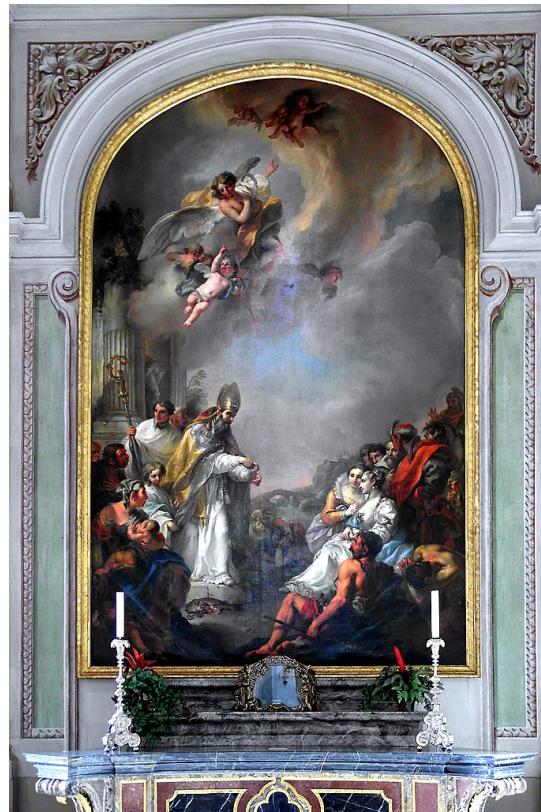
Oltárny obraz so sv. Bennom

svoje modly k biskupovým nohám a pálili ich na znak svojho opravdivého obrátenia. O krátky čas bola obrátená väčšia časť Srbov na Kristovu vieru. Všade staval kostoly a zakladal fary.