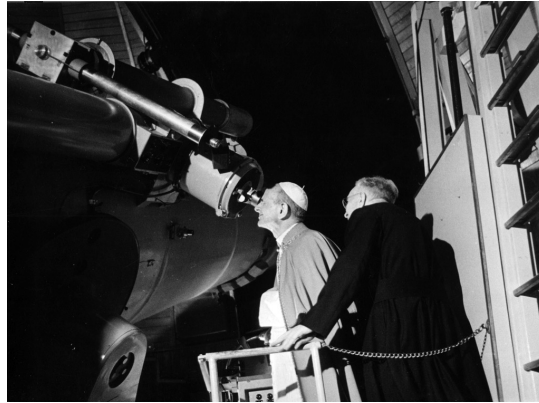
Pápež Pavol VI.

Rubriky Novus ordo missae podporujú toto radikálne netradičné chápanie liturgie neustálym oslabovaním svojich rubrikálnych pokynov a umožňovaním odchýlok a variácií si osvojili pochybnú predstavu, že kňaz je schopný sám čerpať z Tradície alebo zo svojho vlastného zmyslu pre liturgiu, aby doplnil alebo nahradil to, čo sa má povedať a urobiť v rubrikách: toto chápanie „stredoškolskej besiedky“ znemožňuje katolícku bohoslužbu, tak ako ju chápe Tradícia. Tradícia totiž chápala základný význam liturgie vo verejnom uctievaní Boha, ktoré je povinnosťou, oficiom, úradom, ktorá je iste založená na láske, no predsa je to povinnosť. Tento tradičný zmysel pre uctievanie ako oficium, je zakotvený a viditeľný, počuteľný a zažitý v tradičnom rímskom obrade.