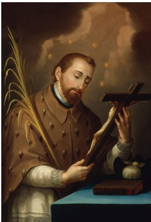
Svätý Ján Nepomucký