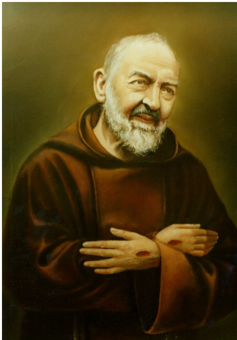
Svätý Páter Pio z Pietrelciny