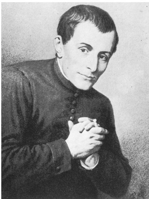
Svätý Jozef Cafasso