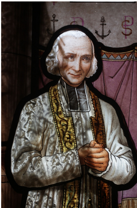
Svätý Ján Maria Vianney

prenasledovaná a mnohé bohoslužby sa konali tajne. Už od mladosti túžil po kňazstve, no štúdium mu spôsobovalo veľké problémy, najmä latinčina. Napriek tomu bol roku 1815 vysvätený za kňaza.