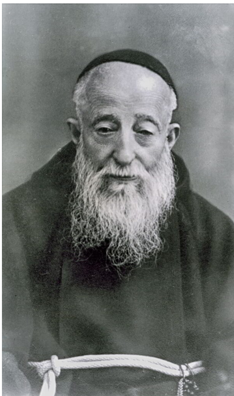
Svätý Leopold Mandić