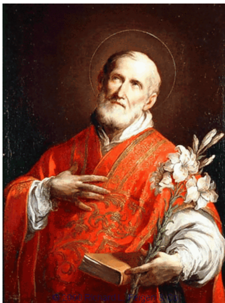
Svätý Filip Neri