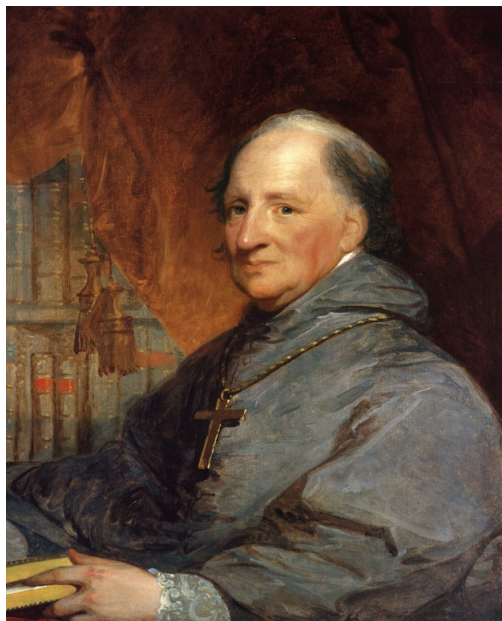
Baltimorský arcibiskup John Carroll na portrétu Gilberta Stuarta, okolo 1806

John Carroll nebyl jediným z rodu Carrollů, původem z Irska, kdo se zapsal do dějin Spojených států. Jeho bratranec Charles Carroll III., který byl svého času považován za vůbec nejbohatšího muže v amerických koloniích, byl jediným katolickým signatářem Deklarace nezávislosti a patří k „otcům zakladatelům“ Spojených států. Pod dlouhé roky byl senátorem státu Maryland a později se stal i senátorem Spojených států. Johnův bratr Daniel Carroll II. je rovněž počítán mezi „otce zakladatele“ a, jak bylo u Carrollů zvykem, se kromě obchodu výrazně věnoval politice. Ač katolík byl zároveň členem zednářské marylandské lóže č. 16. Třebaže John Carroll toto členství osobně neschvaloval, zastával z nějakého důvodu názor, že se církevní tresty ohledně účasti v zednářských spolcích na Ameriku nevztahují. Už jako biskup jednomu věřícímu v dané věci napsal: „Netvrdím, že tato nařízení jsou v Církvi obecně přijímána nebo že mají v této diecézi plnou moc.“ S podobným sklonem, kdy nejsou zásady přímo popírány, nýbrž relativizovány údajně svébytným rázem Spojených států, se později poměrně často setkáme i u dalších představitelů amerického katolicismu.