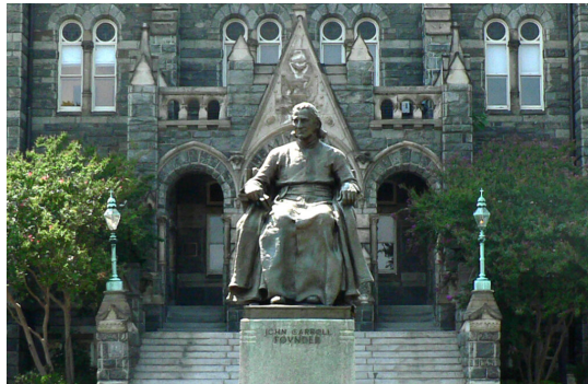
Socha arcibiskupa Johna Carolla, zakladatele Georgetownské univerzity, USA