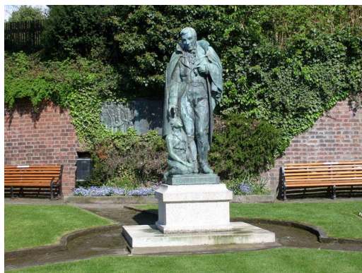
Památník Roberta Owena v Newtowne

Transcendentalisté věřili, že všichni lidé jsou v podstatě „výronem“ jakési „nad-duše“, což byl pojem zavedený básníkem Emersonem. Tato jedna „nad-duše“ sjednocuje všechny lidi v jednu bytost. Emerson v úvodu svého proslovu s názvem Americký učenec říká: „Existuje jeden Člověk, jenž je jednotlivými lidmi zastoupen jen částečně, či jednou vlohou, a je třeba vzít celou společnost, abychom našli celého člověka.“