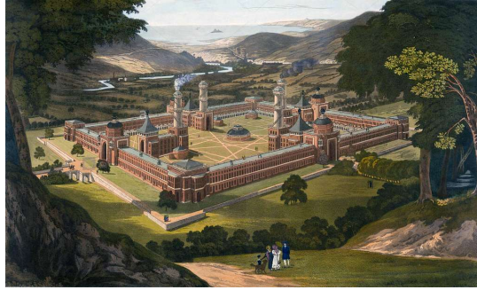
New Harmony, Indiana – utopický projekt Roberta Owena

zkušeností smyslů, pak jsme transcendentalisty.“