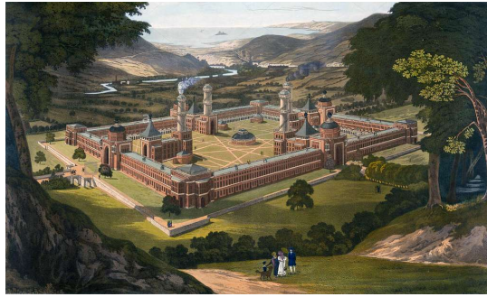
New Harmony, Indiana – utopický projekt Roberta Owena

zkušeností smyslů, pak jsme transcendentalisty.“