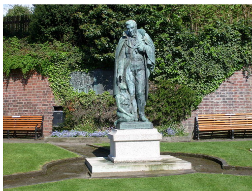
Památník Roberta Owena v Newtowne

Transcendentalisté věřili, že všichni lidé jsou v podstatě „výronem“ jakési „nad-duše“, což byl pojem zavedený básníkem Emersonem. Tato jedna „nad-duše“ sjednocuje všechny lidi v jednu bytost. Emerson v úvodu svého proslovu s názvem Americký učenec říká: „Existuje jeden Člověk, jenž je jednotlivými lidmi zastoupen jen částečně, či jednou vlohou, a je třeba vzít celou společnost, abychom našli celého člověka.“