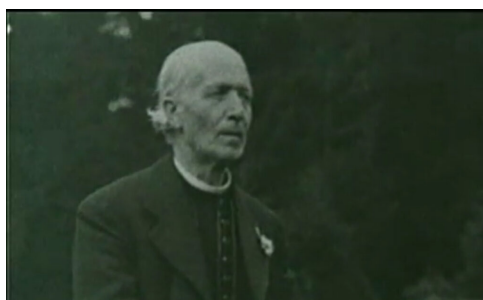
Andrej Hlinka (1864 – 1938), slovenský rímskokatolícky kňaz a neskorší vodca národného hnutia

Slováci mohli vnímať už počas prvého roka existencie tohto štátu, že túžba po rovnoprávnom postavení Slovákov v Česko-Slovensku narážala na mnohé prekážky. Slovenskí katolíci sledovali so znepokojením prenikanie českých sekularizačných tendencií smerujúcich k znevažovaniu a potláčaniu katolíckej viery . A. Hlinka vnímal toto nebezpečenstvo a zápasil za zlepšenie postavenia slovenského národa aj podnikaním namáhavých a riskantných ciest do zahraničia.