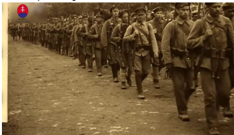
Maďarskí bolševici na Slovensku

Na základe francúzskeho vojenského velenia a s francúzskou vojenskou pomocou prebehla úspešná protiofenzíva. Maďarské bolševické jednotky boli v júni 1919 vytlačené z Banskej Štiavnice, Nových Zámkov, Zvolena a z východného Slovenska. Začiatkom júla 1919, na základe vzájomných rokovaní, maďarské vojská opustili územie Slovenska.