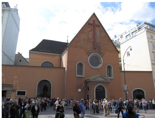
Viedenský Kapucínsky kostol, vpravo vchod do cisárskej hrobky