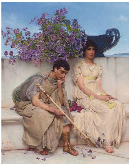
Ilustračný obrázok

Aristotelova politická filozofie je projevem umírněného realismu , s nímž se setkáváme i v jiných oblastech jeho myšlení. Neinterpretuje hodnotu rovnosti rovnostářsky, nýbrž dokazuje, že je možné dostát jejím nárokům i tehdy, když je společnost hierarchicky rozvrstvená . Odmítá předložit teorii tzv. optimálního politického režimu, poněvadž si je vědom, že politik musí brát ohled nejen na to, kdo je člověk, ale i na konkrétní historické, kulturní a ekonomické podmínky dané země . Proto v určitých případech neváhá podpořit zavedení politických režimů, které sice považuje za úpadkové, ale které jsou vzhledem ke konkrétní situaci země momentálně nejlépe proveditelné a poškozují občany méně než režimy jiného typu.