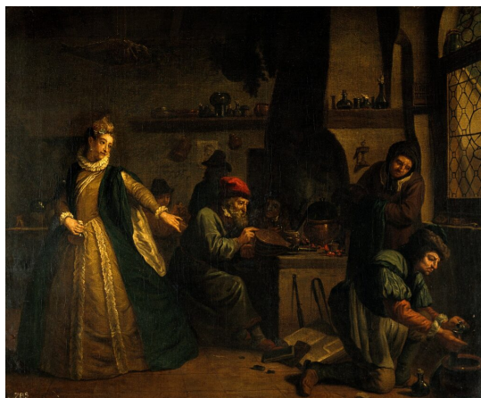
Dáma na návšteve u vedca-alchymistu