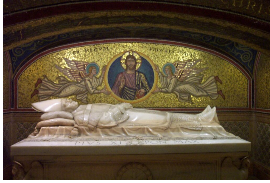
Hrob pápeža Pia XI. strážia mozaiky v byzantskom štýle.

nikdy nebola obmedzená len na západný orbis Latinus .