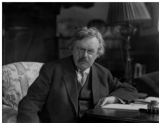
G. K. Chesterton vo svojej pracovni

A pri zmienke o tomto potupení Chestertonovho odkazu sa dostávame k jeho aktuálnosti. Tá spočíva nielen v jeho pravovernosti, ale aj v tom, čo sa dnes bežne nazýva „netoleranciou“. Chesterton, ktorého si úplne zavádzajúco chcú dnešní kresťanskí liberáli prisvojiť pre seba, bol v skutočnosti zarytým anglickým nacionalistom (odmietajúcim britské impérium práve kvôli jeho multikultúrnosti, globalizmu a bankárskej oligarchii), odporcom islamu a všetkých orientálnych náboženstiev, ktoré bytostne neznášal a takmer v každej poviedke alebo románe nevynechal jedinou príležitosť, aby ich nekritizoval a nezosmiešňoval (viď najmä román Lietajúci hostinec ), bojovným odporcom ateizmu, agnosticizmu a protestantizmu, ako aj kapitalizmu a socializmu, ktoré považoval spolu s Bellocom za dve cesty do novodobého otroctva.