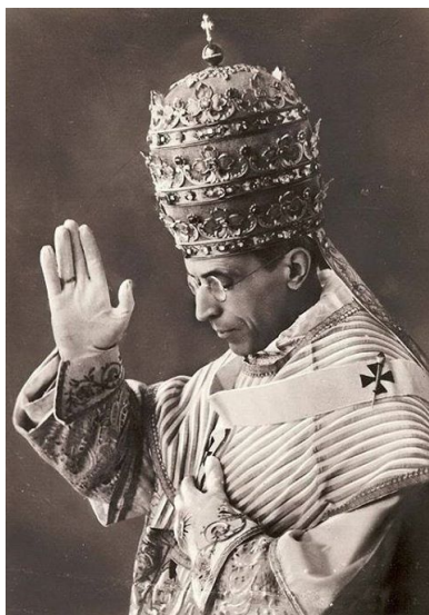
Foto: Pius XII. s tiarou

Potom som videla všetko, čo sa týkalo protestantizmu , ktorý postupne nadobúdal vrchol a katolícke náboženstvo sa rútilo do úplného úpadku. Mnoho kňazov bolo priťahovaných zvodnými náukami, ktoré hlásali mladí učitelia, a tie všetky prispievali k dielu skazy.