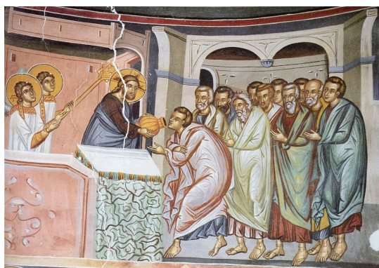
Prijímanie svätých apoštolov, stredoveká byzantská freska.

Šiestu časť nášho cyklu o eucharistickej úcte v liturgickom živote východných kresťanov venujeme symbolike, genéze a významu gréckokatolíckeho zvyku prijímať Eucharistiю s rukami zloženými na prsiach a tiež starobylej byzantskej praxi bozkávania kalicha po svätom prijímaní.