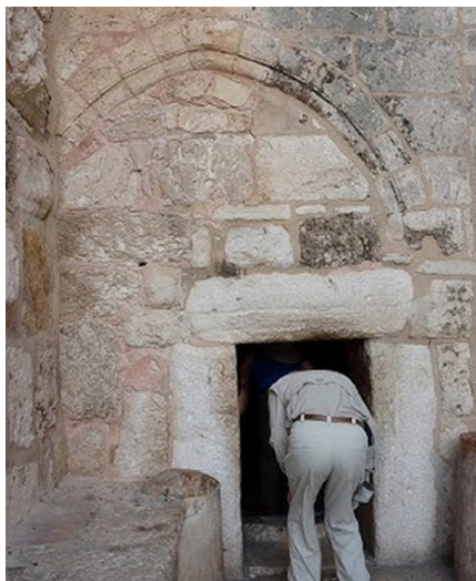
Brána pokory v betlehemskej bazilike Narodenia Pána.

Gesto skríženia rúk pred prijatím Eucharistie sa v rumunskom prostredí nahrádza dôstojným prežehnaním sa a proskynézou (poklona a bozk) pred ikonou, ktorej sa veriaci klaňajú, keď prichádzajú ku kňazovi, rozdávajúcemu sviatosť. Z niektorých pravoslávnych kruhov sa ozývajú kritické hlasy, ktoré veneráciu ikon bezprostredne pred svätým prijímaním neodporúčajú. Prečo máme ante communionem uctievať ikonu, na ktorej vidíme Krista ako v zrkadle, keď stojíme priamo pred Pánom pod sviatosťnými spôsobmi? Nikdy však nechýba úklon tela (kňaz drží eucharistickú lyžicu tak, aby sa k nej kresťan pred prijatím Všemohúceho sklonil nielen duchovne, ale aj telesne).