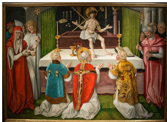
Omša svätého Gregora očami stredovekého umelca.

Zjavenie Pána Ježiša v podobe postavy na oltári je známe aj na Západe. V stredovekom umení bolo zvykom zobrazovať pápeža Gregora Veľkého, ako slúži svätú omšu a na oltári pred ním stojí Vir doloris .