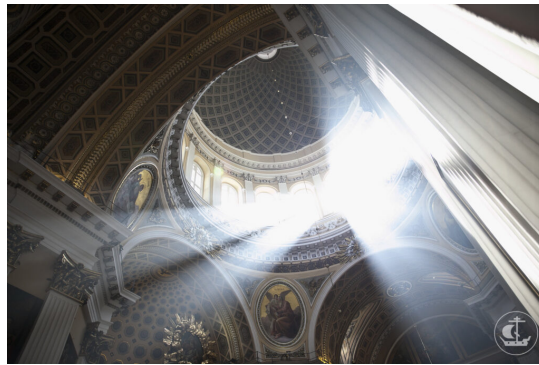
Symfónia svetla v petrohradskej Lavre svätého Alexandra Nevského.