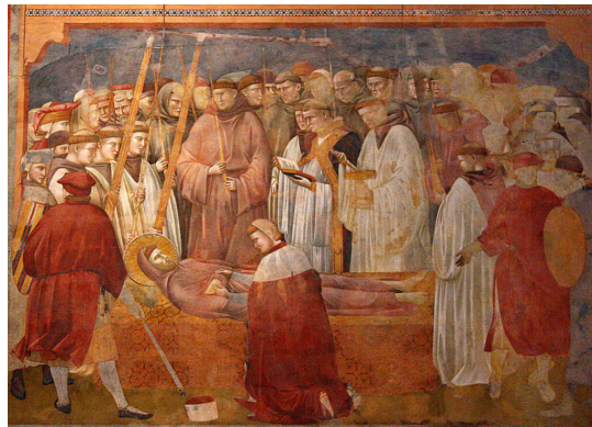
Verifikácia stigiem svätého Františka na Giottovej freske.

Okraje monastických paramanov zdobia biblické verše. Je zaujímavé, že uvedená citácia svätého Pavla de Christi stigmatibus patrí k obľúbeným evanjeliovým odkazom na byzantských paramanoch, čo vlastne len potvrdzuje, že utrpenie apoštola nebolo subjektívnym pocitom diskomfortu, ale jeho prameňom je Kristov kríž.