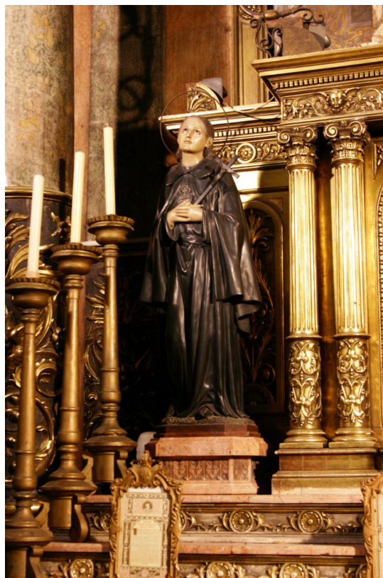
Socha sv. Gemmy Galgani

Gemma však opisuje, že jej anjel dbal aj na veci, nutné pre obyčajný ľudský život: „Včera mi robil spoločnosť, keď som jedla bez toho, žeby ma k jedlu nútil ako iní. Po jedle som sa necítila dobre a tu mi priniesol šálku kávy, bola veľmi dobrá, okamžite ma uzdravila. Potom mi kázal trochu si oddýchnuť. Niekedy som ho poslala k Ježišovi, aby sa ho opýtal, či smie zostať pri mne po celú noc. On mu to povedal, vrátil sa a strávil so mnou noc, keď mu to Ježiš dovolil.“