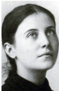
Sv. Gemma Galgani

– celý deň bola v Božej prítomnosti a neprestajne sa modlila.