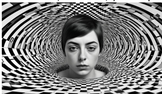
Ilustračný obrázok

I když dimenzí Vesmíru je nekonečné množství, Fedájev se soustřeďuje na poznání čtvrté dimenze . Do čtvrtého, smyslově nepostižitelného rozměru včleňuje ideje, neboť jsou nositeli propriet neredukovatelných na ty charakteristické pro trojrozměrný svět. Autor tedy radí duchovní oblast do čtvrtého rozměru – jedná se o materiální skutečnosti odlišné od trojrozměrného, fyzického prostoru.