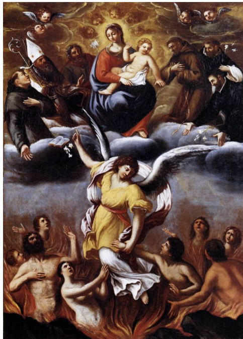
Carracci, Duše v Očistci