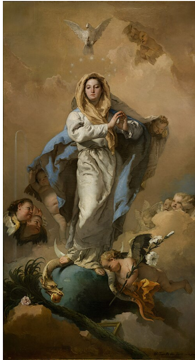
Giovanni Battista Tiepolo, Nepoškvrnené počatie Panny Márie

Podobné skúsenosti pokračovali aj po jej príchode do Ohia, pričom jedna z nich trvala viac než 10 dní. „Keď konečne nadobudla vedomie, bola vyčerpaná a cítila bolesť po celom tele. Obzvlášť cítila nesmiernu bolesť na svojom pravom boku, ktorý bol na pohľad celý pomliaždený,“ uvádza sa na webovej stránke. Po niekoľkých hodinách odpočinku po extatických epizódach „sa cítila celkom dobre a okamžite sa vracala do práce“.