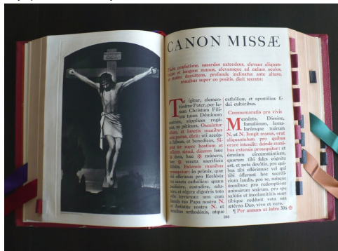
Rímsky misál z roku 1962

Rímsky misál pre kňazov bol liturgickou knihou určenou pre kňaza, obsahoval záväzné texty omše v latinčine spolu s presnými rubrikami a slúžil priamo na jej slávenie, zatiaľ čo Rímsky misál pre veriacich bol neoficiálnou pomôckou, ktorá tieto texty sprístupňovala v preklade, dopĺňala ich o vysvetlenia a pobožnosti a umožňovala laikom vedome sledovať a duchovne sa zapojiť do liturgie bez toho, aby ju sami vykonávali.