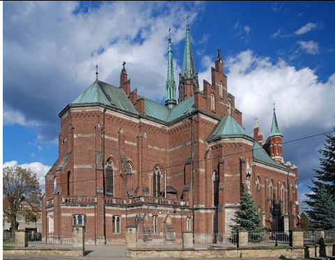
Kostol farnosti Panny Márie Kráľovnej Poľska v Korczyne