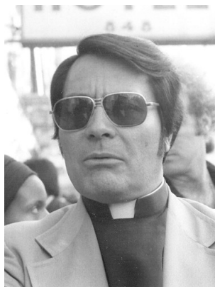
Kazateľ Jim Jones, 1977