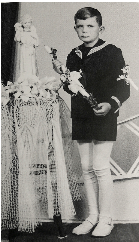
Spomienka na prvé sväté prijímanie.