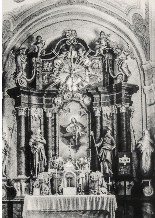
Hlavný oltár v Žemberovciach v roku 1959.

„Mamička spomínala, ako som jej nadšene vrazil: Mami, ja som šťastný, že som katolík! O nejaký čas komunisti tieto procesie zakázali.“