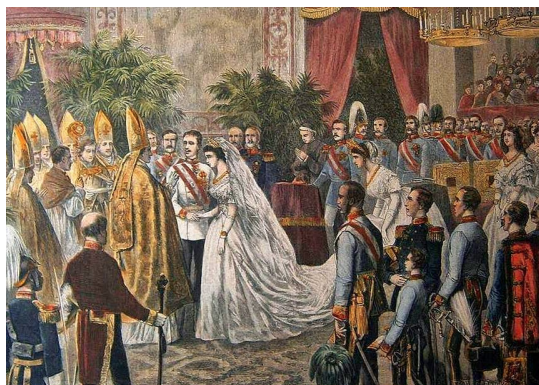
Sobáš Františka Jozefa a Alžbety.