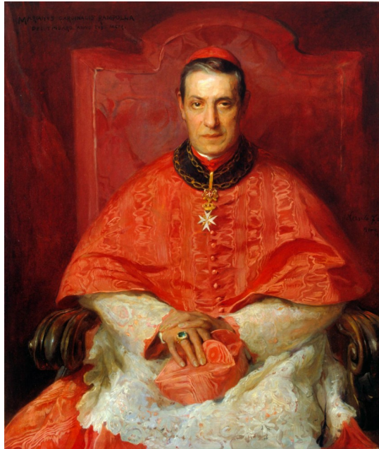
J. Em. Mariano kardínál Rampolla, markíz del Tindaro.