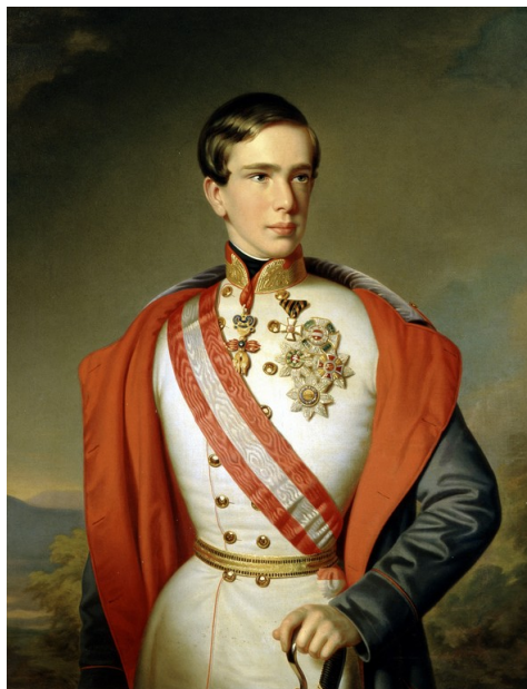
Mladý cisár v roku 1851.

František Jozef sa pôvodne vôbec nemal stať cisárom. No počas krušných revolučných dní sa rozhodol jeho strýko Ferdinand I. (v Uhorsku vládnucci ako Ferdinand V. zvaný „Dobrotivý“) pod tlakom vonkajších okolností Abdikovať. Nástupcom sa mal stať jeho mladší brat František Karol. No Žofia Bavorská presvedčila svojho manžela, aby sa vzdal následníctva v prospech svojho syna Františka Jozefa a to i napriek tomu, že tým zahodila príležitosť byť cisárovnou po boku svojho muža. Tak bola pripravená cesta pre budúceho cisára.