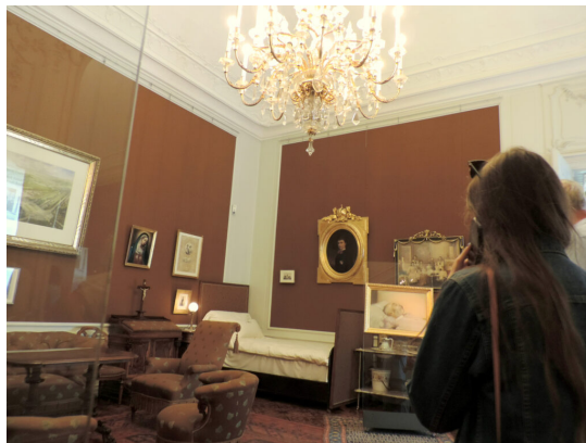
Strohá spálňa cisára Františka Jozefa I. vo viedenskom zámku Schönbrunn.

konský záprah je lepší. “ Svoj odpor k vznikajúcemu „viedenskému metru“ (vtedy nazývané mestská dráha) vysvetľoval slovami: „ Pod zem patria len mŕtvi. “ Elektrinu zaviedli do zámku Schönbrunn až v roku 1898. Hoci bol tento zámok naozaj luxusný, jeho súkromné obytné priestory poskytovali skôr spartánske podmienky. A kúpeľňa? Tú odmietal a celý život sa umýval v dieži (drevená nádoba, ktorej sa hovorí aj škopok). Vrcholom jeho osobnej šetrnosti bolo tiež to, že ako spodné ošatenie používal staré oblečenie so záplatami.