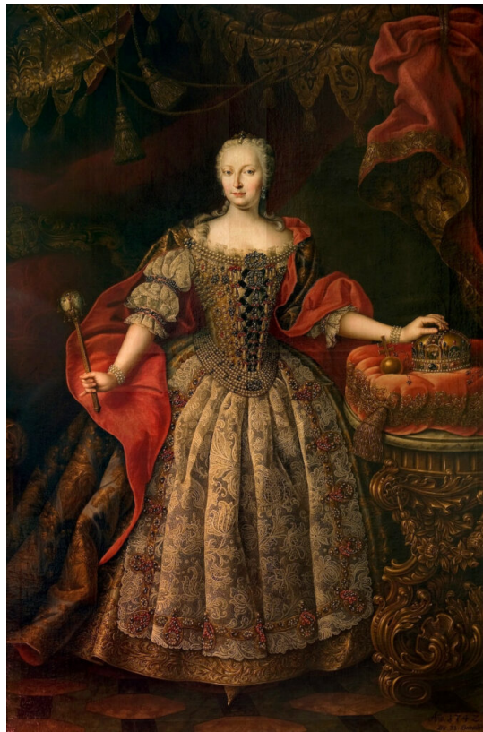
Mladá kráľovná Mária Terézia pózujúca s uhorskými korunovačnými klenotmi.

Útok na habsburské dŕžavy začal pruský kráľ Fridrich II., ktorý si robil nároky na Sliezsko. Keď mladá kráľovná odmietla jeho požiadavku, na jar 1741 úspešným vojenským útokom krajinu obsadil. To bol začiatok vojny, ktorá je známa ako vojna o rakúske dedičstvo. Fridrichov ťah bol samozrejme skvelou inšpiráciou aj pre ďalšie nepriateľské štáty – Francúzsko, Španielsko, Bavorsko a Sasko, ktoré sa spojili s Pruskom.