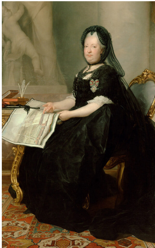
Mária Terézia vo svojej čiernej smútočnej róbe.

Vo veku 48 rokov prišla Mária Terézia o svojho milovaného manžela, čo bola pre ňu obrovská psychická trauma – do konca života za svojím manželom trúchlila, každý mesiac navštevovala jeho hrob a nosila len čierne smútočné šaty. Vo veku 50 rokov prekonala variolu – čierne alebo pravé kiahne. Kiahne jej spôsobili zápal pohrudnice, čo vyústilo k zrastom medzi popľúcnicou a pohrudnicou. Obmedzením pohybu začala priberať na váhe. Tá samozrejme spôsobila záťaž na jej srdce a do toho sa pridružil zúžený pľúcny obeh – pulmonálna nepriechodnosť .