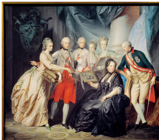
Mária Terézia v kruhu svojich detí.