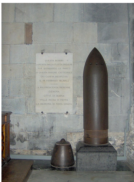
Nevybuchnutý náboj z britského lodného dela

Zaujímavosťou je, že v roku 1941 Angličania ostreľovali Janov a neváhali ostreľovať aj katolícke kostoly. Kostol zasiahla strela z bojovej lode Malaya, ktorá však nevybuchla a dodnes sa nachádza v stene kostola. Považuje sa za zázrak, že náboj nevybuchol a katedrála bola zachránená. Aj nevybuchnutý náboj je symbolom ochrany mesta. Krátko po ostreľovaní mesta nemecká ponorka U-106 torpédovala britskú bojovú loď a vyradila ju z prevádzky.