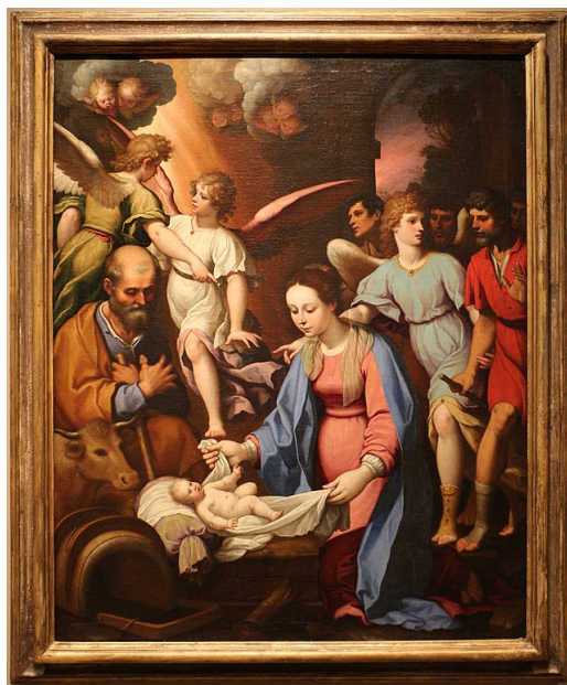
Bernardo Castello, Narodenie Krista