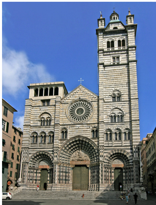
Katedrála San Lorenzo (Svätého Vavrinca) v Janove

Katedrála San Lorenzo v Janove je fascinujúcou zmesou histórie, architektúry a katolíckeho talianskeho duchovného dedičstva. Katedrála zasvätená sv. Vavrincovi je hlavnou rímskokatolíckou katedrálou v Janove. Prvé zmienky o kostole na tomto mieste pochádzajú z 5. storočia, súčasná stavba bola zahájená okolo roku 1098 v románskom štýle, keď bol Janov významným obchodným prístavom. Katedrála bola vysvätená pápežom Gelasiom II. v roku 1118 a v súčasnej dobe je zaujímavá tým, že je zmesou rôznych architektonických štýlov. Základ tvorí románska stavba, fasáda je gotická zo začiatku 13. storočia, zvonica a kupoly sú barokové zo 16. storočia.