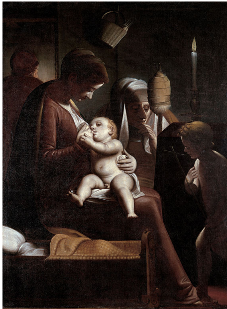
Luca Cambiaso a jeho dojčiaci Madonna pri sviečke

Takisto Luca Cambiaso (1527–1585) je pojmom v talianskom a španielskom neskororenesančnom a ranobarokovom umení. Bol jedným z najvýznamnejších janovských maliarov, výrazne ovplyvnil aj Caravaggia. V závere života odišiel do Španielska na pozvanie kráľa Filipa II., kde pracoval na výzdobe kláštora Escorial. Ako manierista vytvoril množstvo nádherných diel, plných elegancie, zložitých kompozícií, dramatickosti a technickej brilantnosti. Zaujímavo dosahoval trojrozmernosť postáv za pomoci kontrastov svetla a tieňa. Okrem Escorialu môžeme jeho diela obdivovať v Palazzo Doria (sídlo Janovskej republiky) a v mnohých janovských kostoloch. Luca Cambiaso formoval nielen taliansky, ale aj španielsky barok. Jeho dramatický a expresívny štýl pripravil cestu pre Caravaggia a Rubensa.