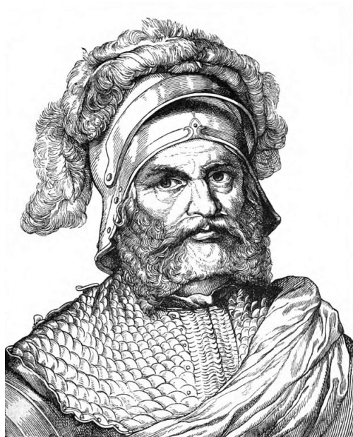
Georg von Frundsberg

Georg (alebo Jörg) Frundsberg sa narodil 24. septembra 1473 v nemeckom Mindelheime a umrel 20. augusta 1528, takisto v Mindelheime. Bol vynikajúcim vojvodcom, vojenským teoretikom a jedným z najznámejších landsknechtských dôstojníkov, ktorí bojovali na katolíckej strane od roku 1490 do roku 1530. Jeho meno sa spája s bojmi Habsburgovcov o udržanie severného Talianska, kde sa nepríjemne aktivizovali Francúzi, ktorí sa snažili obsadiť so svojimi benátskymi spojencami nielen Miláno, ale oslabiť aj vplyv Pápežského štátu a takisto získať nadvládu nad Neapolskom.