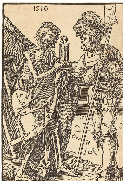
Albrecht Dürer, Smrt a landsknecht , drevoryt, 1510