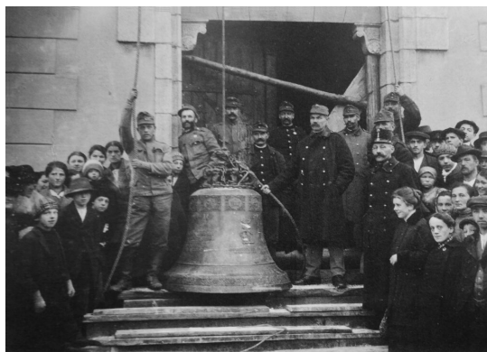
Snímanie zvonov z veže kostola svätej Markéty v Kašperských Horách.