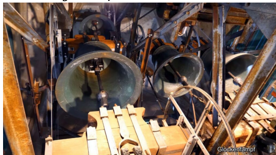
Zvony farského kostola svätého Jakuba, Pfullendorf.

Doplnil by som to ešte českou wikipédiou, kde sa píše: „Pri súzvuku viacerých zvonov je možné dosiahnuť súzvuk harmonický (čím vznikne akord), melodický (stupnice) alebo harmonicko-melodický (akord v stupnici). Kombinácií je veľa, obľúbené bolo napríklad c, es, f – TE DEUM, c, es, f, g – KYRIE. Keď je príliš veľa zvonov, vrchné tóny sa strácajú, preto súzvuk piatich zvonov je asi najlepší, pričom však treba dbať na to, aby sa zvony hojdali v správnom rytme – tak, aby sa navzájom nerušili a všetky boli počut.“