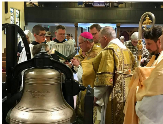
Predkoncilový „krst zvona“ v Omahe...

„Požehnaj, Pane, túto vodu nebeským požehnaním a nech na ňu zostúpi sila Ducha Svätého, aby sa ňou umyla táto nádoba, pripravená zvolať deti Svätej Cirkvi, držiac ďaleko od akéhokoľvek miesta, kde môže zaznieť tento zvon, silu číhajúcich, tieň prízrakov, pustošenie víchrice, úder blesku, poškodenie hromu, pohromu búrok a každý dych búrky; a keď synovia kresťania počujú jeho zvonenie, nech ich oddanosť vzrastie, aby ponáhľajúc sa do lona svojej milujúcej matky Cirkvi mohli spievať Tebe, v kostole svätých, nový chválospev, ktorý v ňom bude hrať hrdý zvuk trúby, melódia harfy, sladkosť organu, radostné jasanie bubna a jasanie cimbalu; a tak vo svätom chráme Tvojej slávy svojou službou a svojimi modlitbami nech privedú množstvo anjelských zástupov. Skrze nášho Pána...“