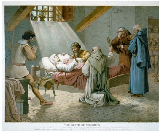
Smrť K. Kolumba, litografia od L. Prang & Co., 1893