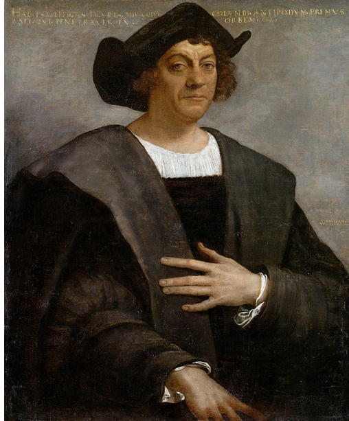
Posmrtný portrét K. Kolumba od Sebastiana del Piombo, 1519

Tribalistické a pro-indiánske aktivistické hnutia 21. storočia cielene vybrali a rozšírili mnohé z mýtov o tomto fenomenálnom moreplavcovi. Osočovaním špinia jeho pamiatku a v snahe podporiť vytvorený obraz „zločinného bieleho muža“, pripisujú Kolumbovi takmer všetko zlé, skutočné i vymyslené, ktoré sprevádzalo koloniálnu éru. Pod vplyvom tejto očierňujúcej kampane mnohí Američania nahrádzajú Kolumbov deň dňom „domorodých obyvateľov“. Často je obviňovaný zo všetkých zverstiev spáchaných neskoršími conquistadormi a je zobrazovaný ako dychtivo prahnúci po zlate.