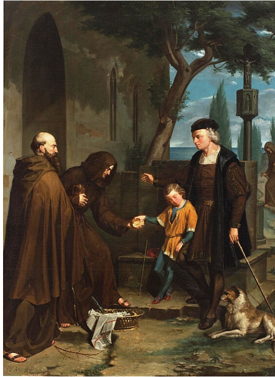
Benet Mercadé, Krištof Kolumbus pred bránami kláštora Santa María de la Rábida so svojim synom Diegom

Severoameričanov k presvedčeniu, že sú iní a nadradení katolíkom zo Strednej a Južnej Ameriky a ako jediní si zaslúžia titul Američanov. Tento mýtus sa zakorenil práve v pýche a nedostatku objektivity.