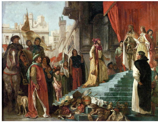
Eugène Delacroix, Návrat Krištofa Kolumba ; jeho publikum pred kráľom Ferdinandom a kráľovnou Izabelou