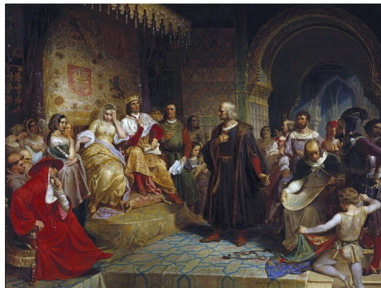
Kolumbus pred kráľovnou v predstavách Emanuela Gottlieba Leutzeho, 1843

Predával deti do sexuálneho otroctva – táto konkrétna lož by bola na smiech, keby nebola taká strašná. Lož má svoj pôvod v liste, ktorý Kolumbus poslal späť do Španielska, v ktorom uvádza: „Je tu veľa obchodníkov, ktorí hľadajú dievčatá; teraz sú žiadané tie od deviatich do desiatich rokov a za všetky vekové kategórie treba zaplatiť dobrú cenu.“ Otravné obvinenie. Citovanie tohto výroku mimo kontext je zámerné, lebo tak sa nespomína jedna absolútne zásadná súčasť textu. Kolumbus sa monarchom na toto zverstvo trpkosť sťažuje! Hneď v ďalších odsekoch sa uvádza, že títo obchodníci si „nezaslúžia v očiach Boha ani sveta ani podať pohár vody“. Ďaleko od toho, aby sa zapojil do takejto činnosti, sa Kolumbus pri svojom návrate na Hispaniolu pokúsil potlačiť toto správanie a prosil monarchov, aby ako kolonistov posielali len čestných a spravodlivých mužov. Napriek tomu existujú takí, ktorí tento citát vytrhávajú z kontextu v snahe vytvoriť z toho príbeh, v ktorom Kolumbus nejakým spôsobom schvaľuje zneužívanie detí. Každý, kto sa obťažuje čítať text, ktorý citujú, tú lož vidí. Pravda sa dá veľmi ľahko overiť.