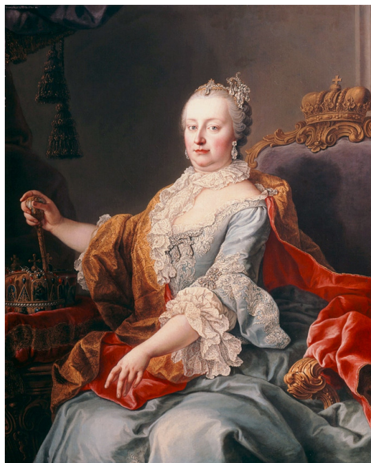
Habsburská cisárovná Mária Terézia

Veľkým odporcom jansenizmu bol nielen kardinál Richelieu, ale aj Kráľ Slnko – Ľudovít XIV. V roku 1710 na príkaz francúzskeho kráľa duchovné centrum jansenistov v kláštore Port Royal francúzski vojaci zničili. Jansenizmus však ovplyvnil aj panovníčku Máriu Teréziu (po smrti jej milovaného manžela). Určité formy jansenizmu sú typické aj pre francúzsky galikanizmus a niektoré starokatolícke cirkvi.