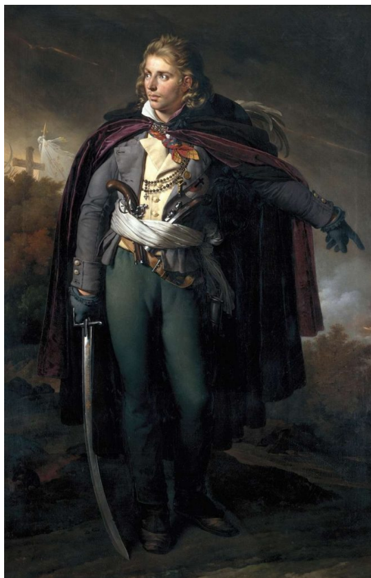
Foto: generál katolíckej armády Jacques Cathelineau