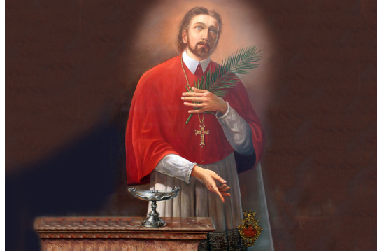
Foto: sv. Marko Križin

Cesty martýrov sa prešli na východnom Slovensku, kde mali misijne pôsobiť pri rekatolizácii obyvateľstva. Tam ich čakalo utrpenie, ale aj slávna palma martýrstva.