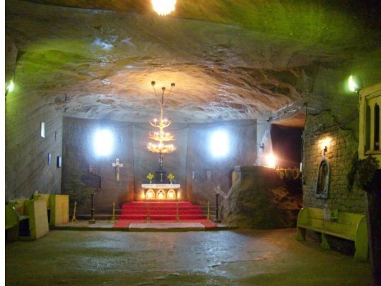
Kaplnka v solných baniach v mestečku Cacica.