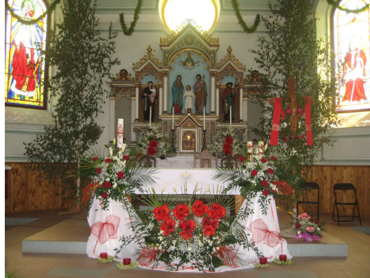
Hlavný oltár katolíckeho kostola v Solonețu Nou (Suceava).