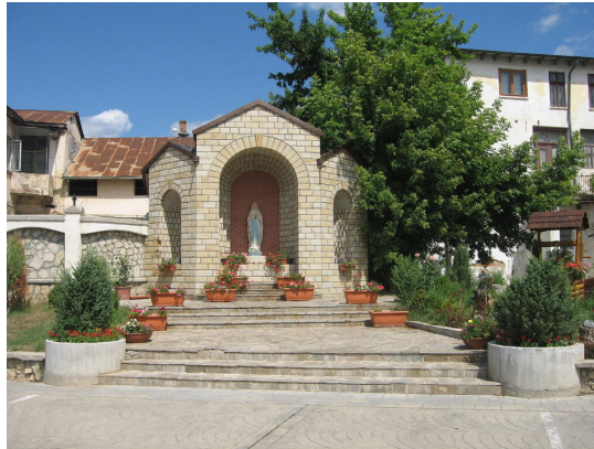
Elegantná lurdská jaskyňa pri katedrále v Iași.

Jazykovedci hodnotia ceangăiesc ako zmes maďarských a rumunských slov a latinských kultizmov – súčasť pestrej balkánskej jazykovej záhrady.