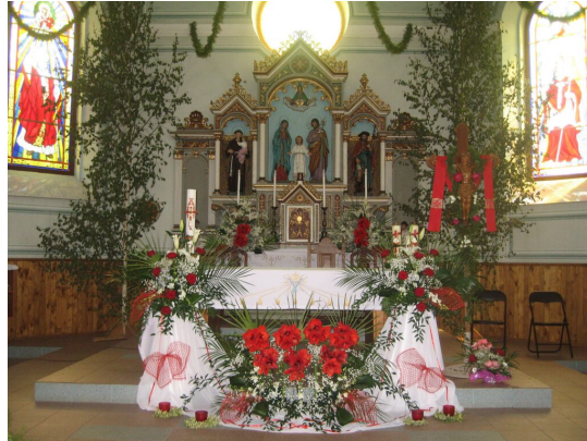
Hlavný oltár katolíckeho kostola v Solonețu Nou (Suceava).