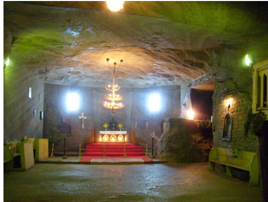
Kaplnka v solných baniach v mestečku Cacica.