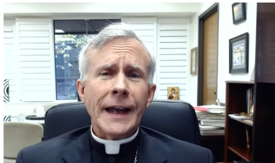
biskup Joseph Stricklad

Proti nemorálnemu biznisu farmaceutických firiem vystúpilo ostro množstvo katolíckych biskupov v USA, Austrálii, Taliansku či Španielsku. Texaský biskup Joseph Stricklad, ktorý odmieta nemorálne vakcíny a na svojom účte na Twitteri doslovne uviedol: „To že sú interrupcie v našom štáte žiaľ legálne neznamená, že musíme morálne pripustiť možnosť používania mŕtvych telíčok detí na liečbu globálnej pandémie, takáto praxe je jednoducho nesprávna a neprijateľná“ Austrálski biskupi ostro protestovali proti vládnemu nariadeniu distribuovať v Austrálii 25 miliónov dávok britskej vakcíny proti Covid-19 vytvorenej zo spomenutých buniek zavraždených detí v prenatalnom štádiu. Časť britských a waleských biskupov protestovali aj proti tomu, že sa v Británii znova prikrročilo k vytváraniu vakcín z „čerstvo získaných buniek“ .