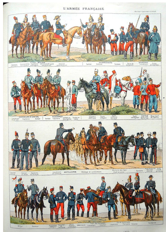
Ilustračný obrázok, zdroj: wikimedia commons

V roku 1879 na bankete pri príležitosti zrušenia nevoľníctva Victor Hugo povedal: Boh daroval Afriku Európe. Vstupom do Afriky riešite sociálne problémy a proletárov zmeňte na vlastníkov. Stavajte cesty, budujte prístavy, postavte mestá!