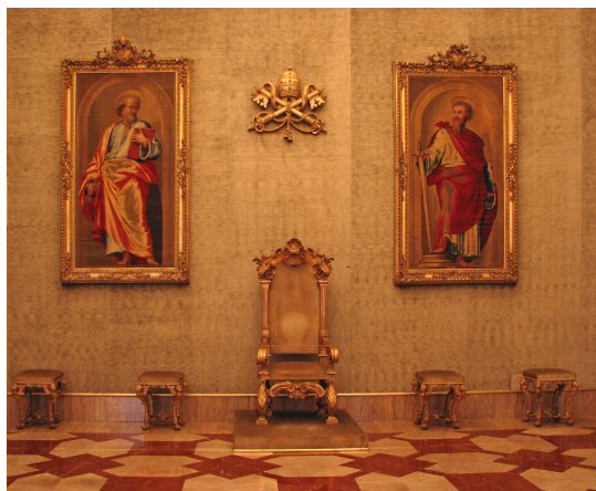
Ilustračný obrázok

Žijeme teda v období sede vacante ? McCusker hovorí, že triezva teologická analýza by to potvrdila, necháva však na čitateľov, aby sa rozhodli, či jeho interpretácia citovaných autorov je dostatočne presvedčivá alebo nie. Podobne urobíme aj my a ponecháme na tých, ktorých to zaujíma, aby si preštudovali argumenty a spôsob, akým ich McCusker spája a posúdili nakoľko sú presvedčivé.