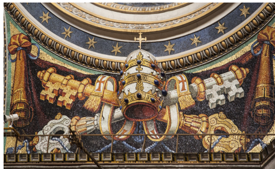
Ilustračný obrázok

Ale mohol by tento úpadok zahŕňať aj pápeža? Samozrejme, platného pápeža by sa to dotýkať nemalo. Čo sa potom však deje v Ríme, z ktorého prichádzajú teologicky, liturgicky a mravne stále zmatenejšie signály, príkazy a nariadenia?