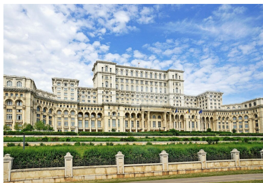
Neslávne známa budova rumunského parlamentu.

Do hľadáča médií sa tento vzdelaný muž dostal kvôli svojim tvrdým vyjadreniam na adresu korupcie v rumunskom politickom rybníku. Dotiahol to na poslanca v Európskom parlamente, kde je pravidelne trňom v oku liberálne cítiacich súdruhov. Liberáli (a nielen oni) majú v živej pamäti jeho vyjadrenie z roku 2023, že transrodové ženy sú „perverzné mužatky“ („ perverși masculini “).