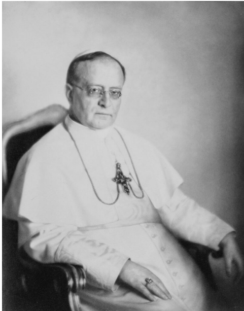
Pápež Pius XI.

No a teraz si uveďme sedem základných bodov katolíckej predstavy starostlivosti o stvorený svet – princípy, ktoré existovali dávno pred encyklikou Laudato si' a ktoré ukazujú, že kresťanské chápanie zodpovednosti za prírodu má v Cirkvi omnoho hlbšie korene, než sa dnes často tvrdí.