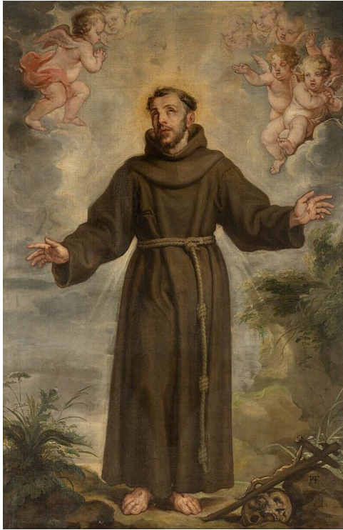
Svätý František z Assisi

správcom stvorenia, nie jeho otrokom, ale ani absolutistickým tyranom. Práve táto rovnováha medzi užívaním sveta a úctou k nemu tvorila jadro klasického kresťanského pohľadu na prírodu.