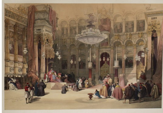
Ikonostas v Chráme Božieho hrobu v Jeruzaleme. Kolorovaná litografia z 19. storočia.

Pravoslávni z dlhodobého hľadiska neodmietali rôzne, často i nečestné finančné transakcie spojené s indulgenčnými listami, snáď kvôli ťažkej ekonomickej situácii historických patriarchátov v tieni tureckého polmesiaca.