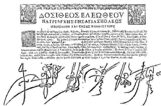
Odpustok vydaný jeruzalemským patriarchom Dositheom.

V našom predchádzajúcom článku sme in breve vysvetlili, v čom spočíva doktrinálna diskordancia medzi latinskou a gréckou koncepciou odpustkov. V dnešnej časti spoznáme koncilové definície Jeruzalemského patriarchátu vo vzťahu k indulgenciám a predstavíme vám preklad dobového odpustkového listu z ruského prostredia.