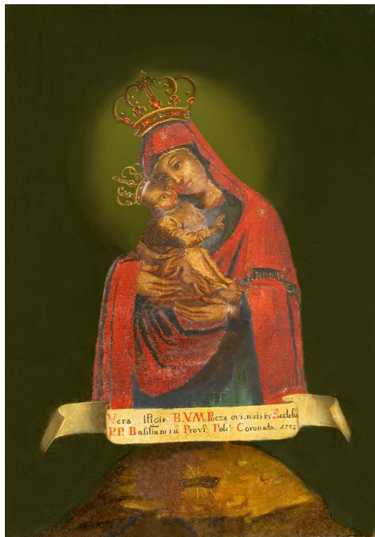
Počajevská ikona Matky Božej s latinským nápisom.

Pravoslávne authority teda prišli s vlastnou odpustkovou iniciatívou pod tlakom okolností, aby ich veriaci neopúšťali pravoslávny ovčinec. Citovaný článok z portálu Oodegr.com k tomu dodáva, že vydávanie odpustkových listov bolo okrajovou aktivitou a zachovaných primárnych prameňov ad rem propriam je málo.