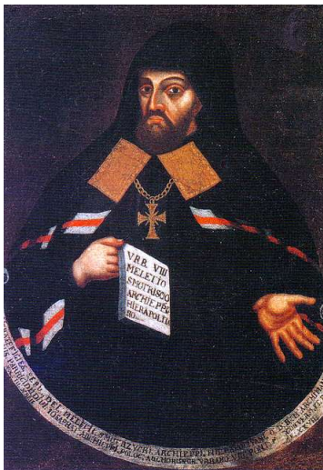
Portrét Meletia Smotryckého.

„ Acta, non fabula! “ volali starí Rimania. Činy, nie slová, mystifikácie, fabulácie. Stačí len posunúť čiarku (ktorá v stredovekých textoch nebývala vecou každodennou) a dostaneme „ acta non, fabula “ („nie činy, ale slová“).