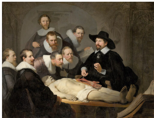
Rembrandt, Lekcia anatomie doktora Tulpa (1632)

Aby tuto v jeho očích neblahou tendenci zkorigoval, klade provokativní otázku: „Někdo se snad domnívá, že myšlenka, náboženská extáze a mravní statečnost mohou existovat bez ubohé slinivky břišní, bez krevního oběhu a nervového systému?“ A pokračuje: „Kulturalismus sází na adjektivum „duchovní“ a úplně přetíná spojení se substantivem „život“; zapomíná, že adjektivum pouze blíže určuje substantivum a že bez substantiva neobstojí... Rozum usilující o to, nebýt pouhou vitální funkcí mezi všemi ostatními a nepodléhat témuž životnímu rytmu jako ony, je jen těžkopádnou abstrakcí a čirou smyšlenkou . Takový rozum neexistuje.“