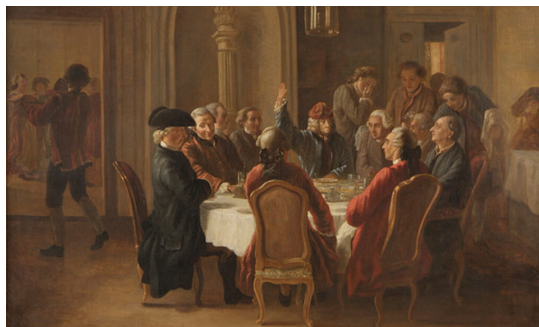
Ilustračný obrázok

Popri nich sa začali presadzovať paralelne myšlienkové smery ako: demokratizmus, nacionalizmus, liberalizmus a pod. Celá táto zmes bola držaná pohromade veľkým očakávaním intelektuálov ohľadom zmien v myslení a správaní ľudského rodu. Táto viera v ľudský rozum a jeho neobmedzené možnosti, napriek tomu, že dočasne zakúsila koncom 18. storočia nepríjemný debakel, keď bola utopená v krvavých riekach Francúzskej revolúcie, lomcuje ľudstvom dodnes a tak ako sa osvietenci s pýchou dovoľávali 18. storočia, tak sa dnešní pokrokári dovoľávajú storočia 21.