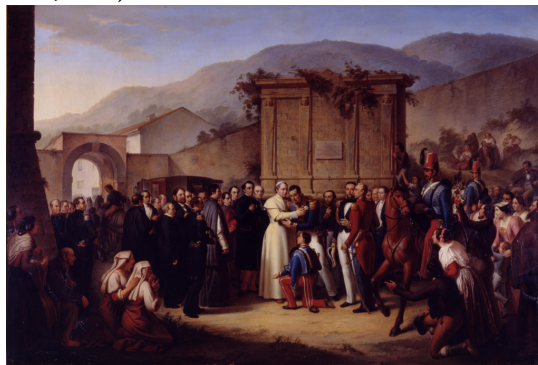
Pius IX. a kráľ Ferdinand II. Neapolský

Rad pápežov nasledujúcich po Piovi VII. (Lev XII., Pius VIII., Gregor XVI.) sa snažil zúfalým spôsobom zastaviť revolúciu tak v duchovnej, ako aj vo vojenskej rovine. Nakoniec však bolo Prozreteľnosťou určené, že Pápežský štát revolúcii podľahne. Stalo sa tak počas vlády Pia IX., pápeža, ktorý sa stal posledným svetským vládcom Pápežského štátu, trvajúceho od dôb Karola Veľkého.