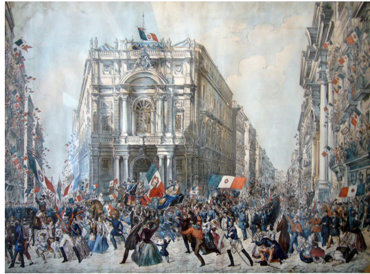
Revolúcia v Taliansku

Šľachta zaniknutého Pápežského štátu odmietla spolupracovať s mocou, ktorú považovala za uzurpátorskú a zostala verná pápežovi a Cirkvi. Dlhé desaťročia odmietala ponuky na výhodné diplomatické a politické posty. Odmenou za túto vernosť však bola nakoniec zvláštna forma vďačnosti po II. vatikánskom koncile – šľachta bola odsunutá nabok ako nepotrebná alebo dokonca kompromitujúca pre Cirkev.