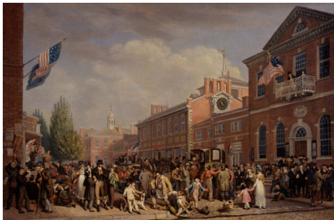
John Lewis Krimmel, Volebný deň v USA, 1815

Ešte bizarnejšie pôsobia tieto nariekania nad polarizáciou z úst cirkevných predstaviteľov. Pokiaľ si niekto dá tú námahu a nazrie do Svätého Písma, do cirkevného učenia, do spisov svätcov, ako aj do elementárnej kresťanskej psychológie, tak neustále naráža na slová o boji, rozdelení, spore, selekcii na dobrých a zlých, cnostných a hriešnikov, anjelov a diablov, na protiklady medzi Cirkvou a pohanmi, medzi Cirkvou a heretikmi, a dokonca na slová o permanentnej vnútornej polarizácii v každom človeku, ktorá nás sprevádza po celý život až do poslednej minúty.