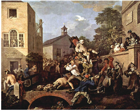
William Hogarth, Volby v Anglicku 18. storočia

raketovou rýchlosťou, vznikli minulý rok?