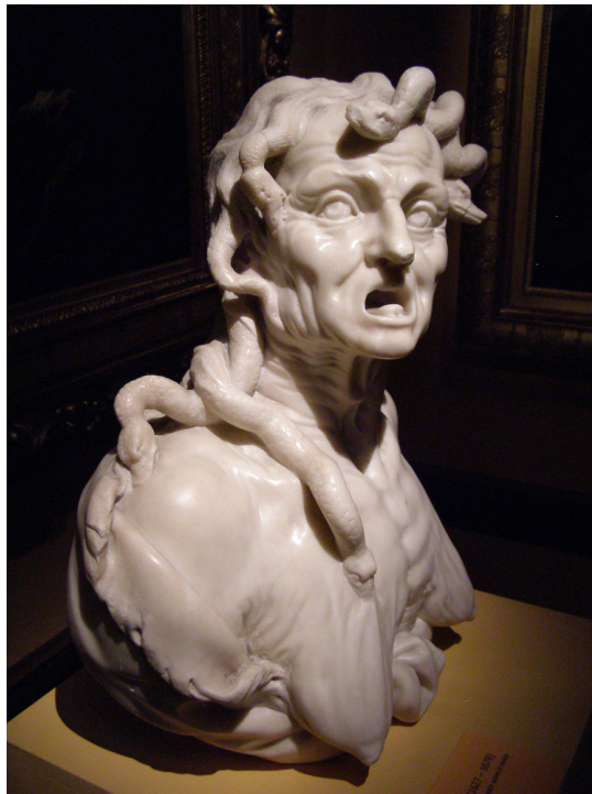
Ilustračný obrázok: Závist

V týchto tirádach vidieť charakteristické znaky hriechu závidi, ako ju chápe Akvinský. Samotný fakt, že niektorí majú dobrá, ktoré iní nemajú, sa považuje za sám osebe netolerovateľný; osoba, ktorá namieta proti tejto nerovnosti, to robí očierňovaním tých, ktorí tieto dobrá vlastnia, zľahčuje alebo popiera ich prednosti a vyzdvihuje a zveličuje ich neresti; a má cieľ aj iným spôsobom ich psychicky a materiálne poškodiť.