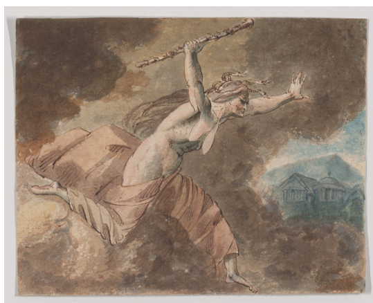
Alegória na závišť