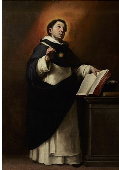
Sv. Tomáš Akvinský na obraze Bartoloméa Estebana Murilly z roku 1650

To, že existuje prirodzená nerovnosť medzi anjelskou dokonalosťou a božskou dokonalosťou, a že tá prvá sa ani len nepribližuje tej druhej, bez pomoci Toho, kto je dokonalejší, to je pre démonov neznesiteľné. Je to pre nich nespravodlivosť, ktorá ich bolí ako urážka ich pýchy. Tento pocit je v démonoch taký hlboký, že podľa sv. Tomáša, „keď nás diabol zvádza blížnemu závidieť, láka nás k tomu, čo má v jeho srdci ústredné miesto“.