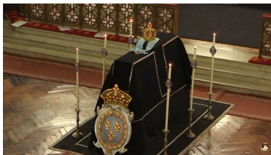
Messe solennelle de Requiem pour Louis XVI.

Táto ponurá krása s Božími Milosťami patrí zosnulému kráľovi Ľudovítovi XVI., ktorý sa 21. januára 1793 stretol vďaka „národnej britve“ so svojím Stvoriteľom.