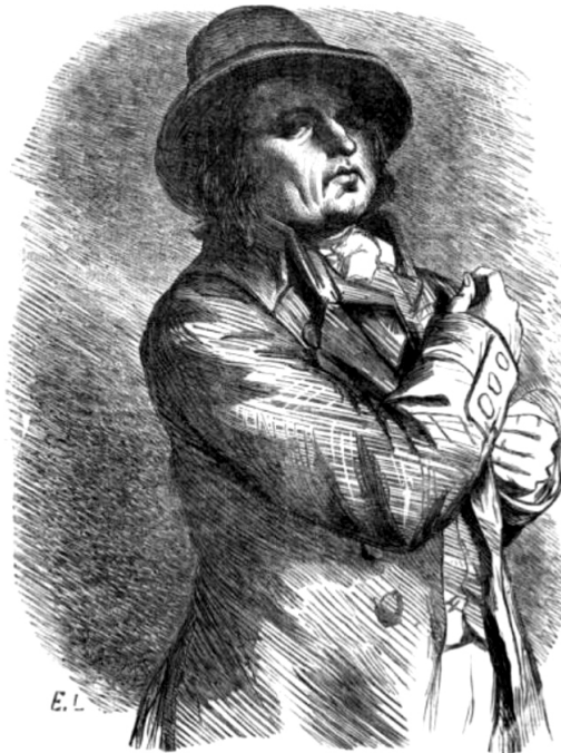
Charles-Henri Sanson de Longval

Dňa 20. januára 1793 dostal Charles-Henri Sanson de Longval (francúzsky kat pochádzajúci z rodiny, kde sa toto povolanie dedilo niekoľko generácií) rozkaz postaviť gilotínu na Námestí revolúcie. Nasledujúci deň mal byť pod ňou popravený Ľudovít XVI. Gilotína totiž nebola majetkom štátu, ale nástroj kata – jeho vlastníctvo. Popri tomto rozkaze dostal Sanson aj nepodpísaný list s vyhlásením, že kráľ bude zachránený, a preto anonymný autor požadoval, aby popravu oddaľoval. Táto predstava sa Sansonovi páčila, poprave kráľa nebol vôbec naklonený. Zároveň však dostal aj druhý anonymný list, v ktorom sa mu vyhrážali, aby sa nepokúšal zmať kráľovu popravu.