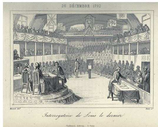
Súd s Ludovítom XVI. pred Národným konventom.

úlohou nie je vysloviť nad niekým súdny rozsudok, ale prijať opatrenie v záujme verejného blaha. Pokiaľ ide o mňa, prieči sa mi trest smrti a k Ludovítovi necítim lásku ani nenávisť. Ale zosadený kráľ v lone revolúcie, ktorá má ešte ďaleko k tomu, aby bola pevne zakotvená, taký nemôže byť zneškodnený uväznením alebo vypovedaním. S bolesťou vyslovujem osudnú pravdu: je lepšie, aby zomrel Ludovít, než aby zahynulo 100-tisíc poctivých občanov...”