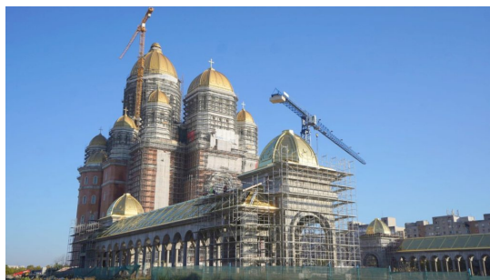
Stavebné práce pokračujú.

Kurz imperiálnej Cirkvi bol opačný, veď fundácie Kristovho služobníka v purpure Konštantína Veľkého oplývali monumentalitou a leskom. Per exemplum , ranokresťanská bazilika v Tomide (dnešná Constanța na brehu Čierneho mora) mala šírku 40 metrov a jej „sestra“ v antickej Histrii ju prevyšovala takmer o 20 metrov! Hagiu Sofiu cisára Justiniána netreba zvlášť predstavovať. Každá byzantská katedrála, či už je metropolitná alebo limitrofná kdesi na okraji bývalej ríše, kde líšky dávajú dobrú noc, rastie v šlapajach veľkého Justiniána.