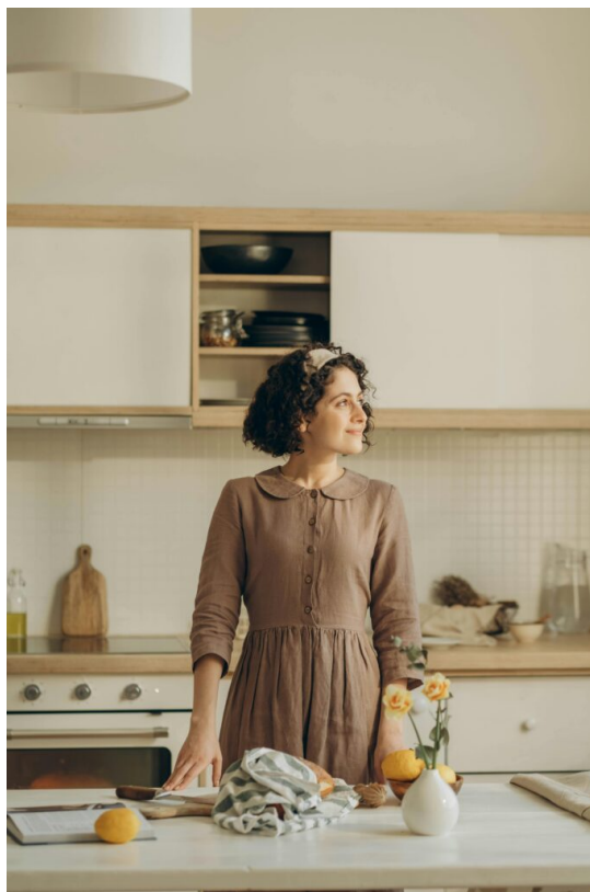
Ilustračný obrázok