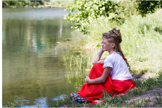
Ilustračný obrázok, zdroj: pickpik.com

nebude správne, aby ženy zahmlili alebo vytlačili tradičné katolícke učenie nárokováním si práva nosiť nohavice.