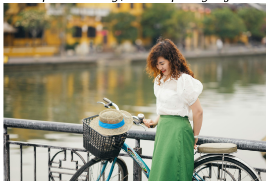
Ilustračný obrázok

„Kde môže bez viery, bez kresťanského vzdelania, zbavená pomoci Cirkvi, nájsť zmätená žena odvahu plniť neochvejne morálne požiadavky, ktoré prevyšujú čisto ľudské sily?“