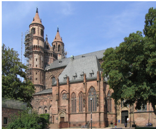
Katedrála vo Wormse

Celý konflikt medzi rímskonemeckými cisármi a pápežmi ukončil tzv. Wormský konkordát medzi pápežom Kalixtom II. a cisárom Svätej ríše rímskej Henrichom V., ktorý bol uzavretý 23. septembra 1122. Dohoda medzi Kalixtom II. a Henrichom V. sa však nerodila ľahko, Henrich V. sa takisto pokúsil násilne presadiť práva svojich predchodcov. Pápež Kalixt II. musel dokonca Henricha V. exkomunikovať, aby panovník prišiel k rozumu. Henrich V. však vedel ako dopadol jeho otec Henrich IV. v zápase o investitúru s pápežom Gregorom VII. a keď sa presvedčil, že prívrženci pápeža majú v Svätej ríši rímskej značnú podporu, nakoniec súhlasil s Wormským konkordátom.