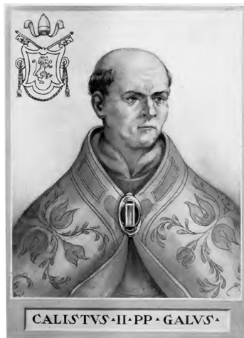
Pápež Kalixt II.

Prvý lateránsky koncil potvrdil Wormský konkordát medzi pápežom a cisárom, ktorý priniesol dohodu medzi pápežom Kalixtom II. a Henrichom V., cisárom Svätej ríše rímskej. Na základe Wormského konkordátu pápeži mohli menovať biskupov a skončil sa tým Boj o investitúru, ktorý vyčerpával tak Svätú ríšu rímsku ako aj Cirkev.